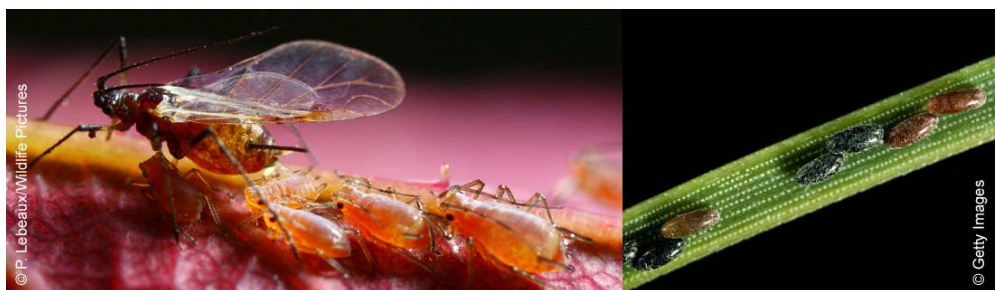
Larves de pucerons